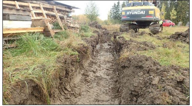
Vesihuoltolinjan pohjoisosaa Mottisenniemen johtavan kylätien eteläpuolella. Ylinnä normaali kerros peltomultaa ja sen alla tiivis luontainen savi. Kuvat pohjoiseen (vas.) ja koilliseen (oik.).