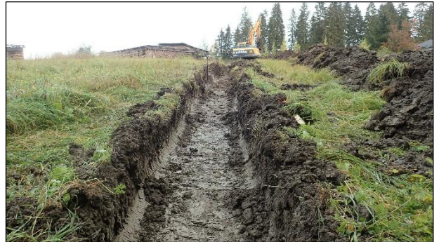
Vasemmalla: Linjan keskiosaa. Kaivannon seinämässä näkyy ylinnä normaali kerros peltomultaa ja sen alla tiivis luontainen savi.